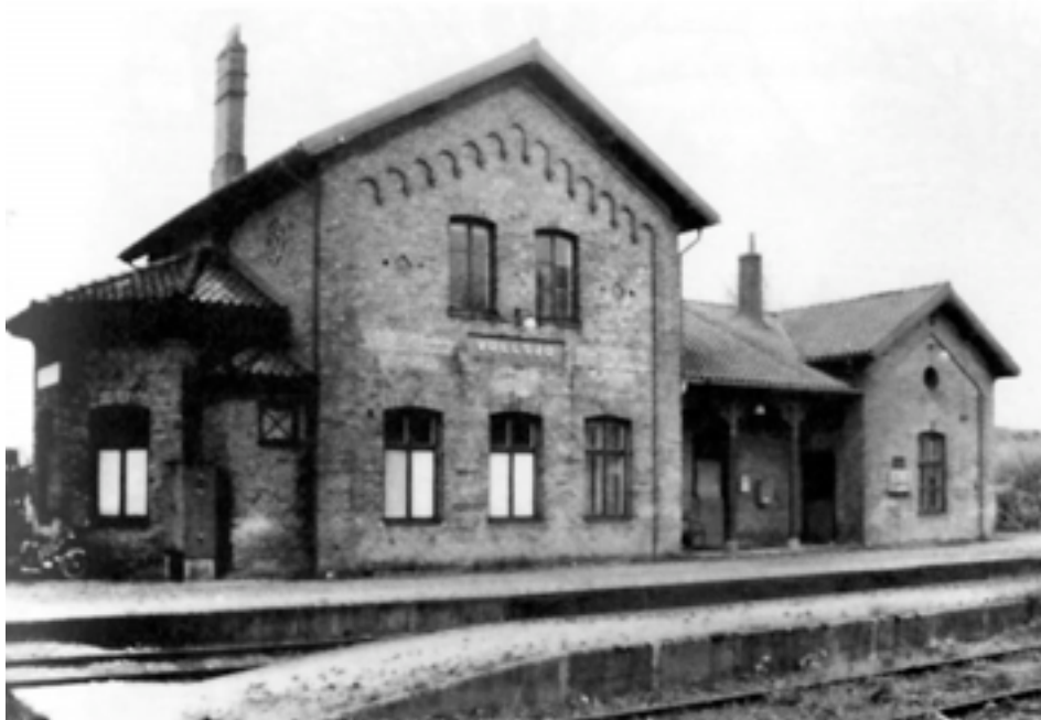
Vollsjö station -Piratens föräldrahem

Det skånska teglet fick strykande åtgång när alla järnvägsstationerna skulle byggas. Det var inga anskrämliga “miljonbyggen”, utan de utformades smakfullt med arkitektnsatser. Många har bevarats och fått annan användning när järnvägen lagts ned eller stationerna dragits in. Men Fritiof Nilsson Piratens Vollsjö kunde inte räddas undan förgängelsen.