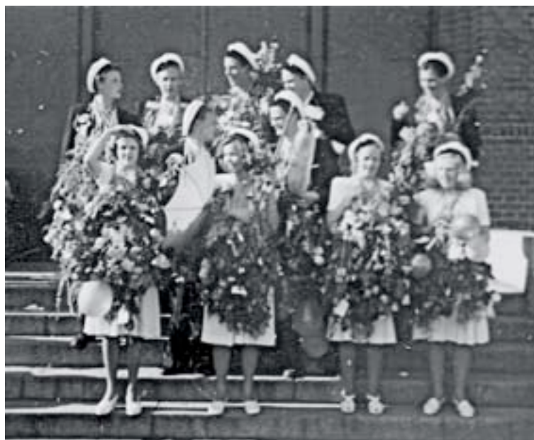
Dag 1 var vi 11 st