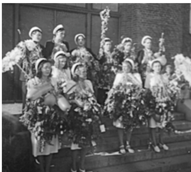
11 st dag 3