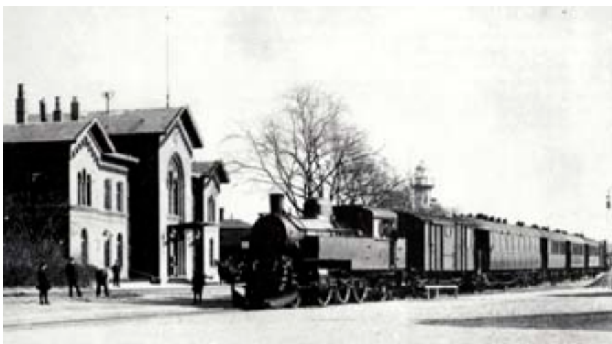
Vi tog tåget från Simrishamn till Ystad

Nu skulle far och jag hämta hem honom från båten i Ystad.