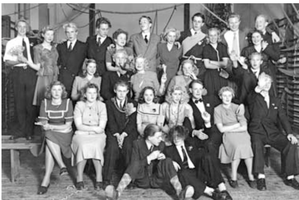
Äntligen dök han upp , fotografen!

Flickskolan var till vardags en otillgänglig borg - ett harem kanske, nej, jag tar tillbaka, ingen bra liknelse - men någon gång om året ställdes det till med klassdans, då också tillgången på killar i gymnasiet inventerades. Och valda delar inviterades efter rektors godkännande.