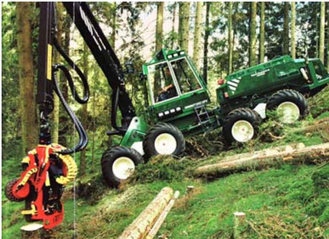
Modern skördare som fäller, kvistar och delar stocken.

Inte anade jag att jag 25-30 år efter studenten som divisionschef i Kockums Industri skulle vara med om att utveckla terränggående maskiner som med hydraulik och förbränningsmotorer kunde utföra det mesta som krävt muskelkraft hos människor och hästar.