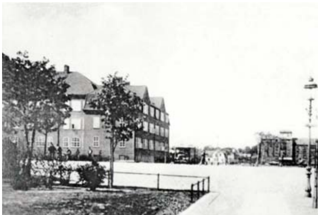
Den första gång jag såg dig....

Så här såg lastbåtarna ut under kriget. Inga skönheter precis som efterträdde segelfartygen. Farfars båt, ångaren Ludwig, gick in till hamnen i Ystad. Det var gripande att se en gammal sjöbuss ta ett sista farväl av sjömanskapet.