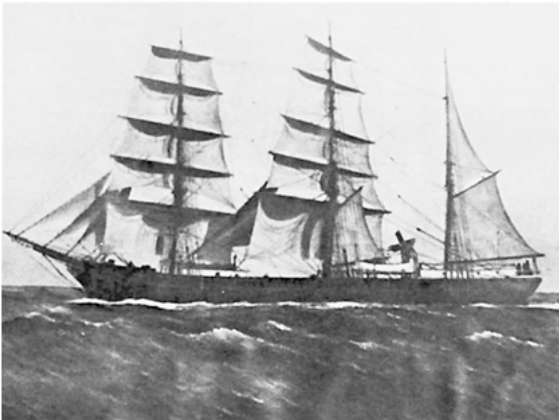
Björkegrens bark Wolfe

Simrishamn med samhällena på Österlen var under slutet av förra seklet Sveriges andra sjöfartsstad efter Göteborg. Det var segelfartygens förlovade tid. Det Björkegrenska handelshuset seglade i djupsjöfart med råsegelriggade barkskepp. I övrigt var det fråga om små och medelstora fartyg för seglats på Öster- & Nordsjön. Kivik, Vitemölle, Brantevik och Skillinge var hemort för större delen av flottan som drevs av partrederier med delägare från samhällena och bygden.