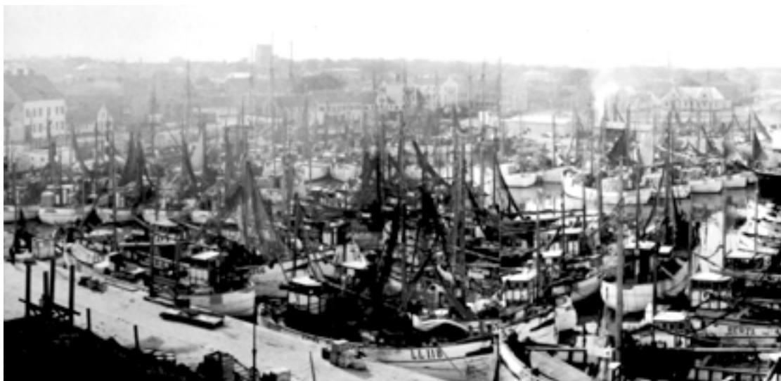
Innerhamnen knökfull med bohyslänningar

Under avspärningen i väst kom bohusflottan till Simrishamn och gav en injektion både vad gäller fiskemetoder, samhällsliv och dialekter. Några andra främmande inslag såg vi inte till på den tiden.