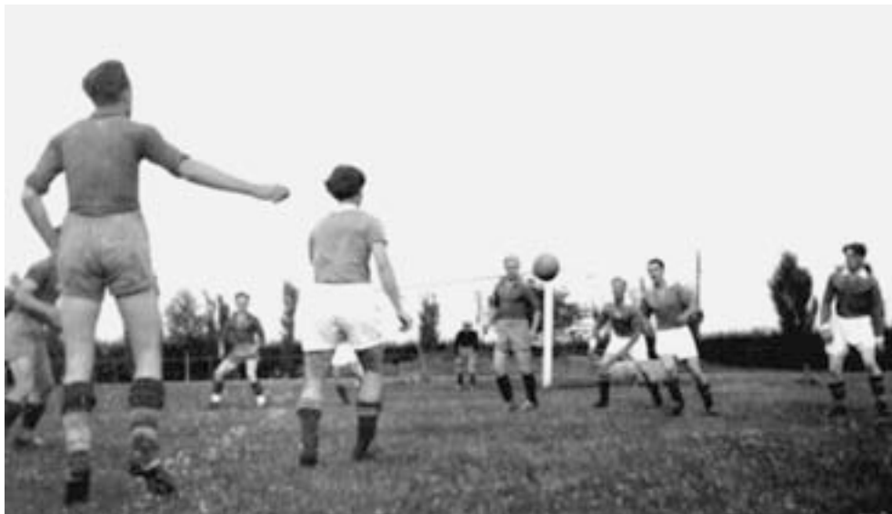
IFK Simrishamn med mig som målvakt