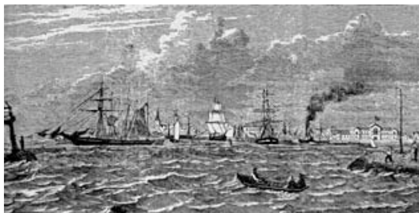
Ystad från reddan 1860

Ystad var av hävd porten mot Europa. Karl XII:s färd från Stralsund är ju känd. När haven dominerade samfärdseln var Ystad en viktig knutpunkt mellan land- och sjötransporter. Den blev också en betydelsefull handelsstad med stapelrättigheter. Det präglar den också i modern tid. Bilderna visar hamnens utveckling sedan mitten på 1800-talet.