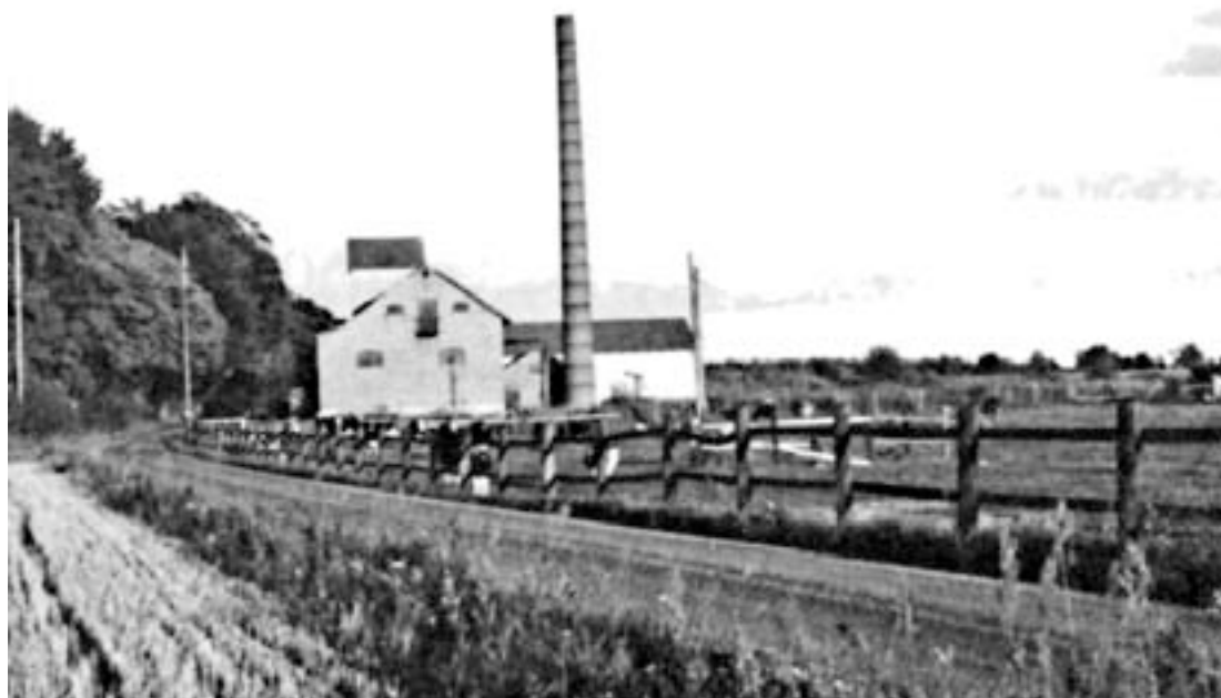
Folkestorps bränneri - råspriten framställdes lokalt.

Brännvinets “välsignelse” gav också sysselsättning i form av brännerier som utnyttjade den högkvalitativa skånska råvaran, potatis och säd. Det är en business som blivit internationell och tagits om hand av Åhus.