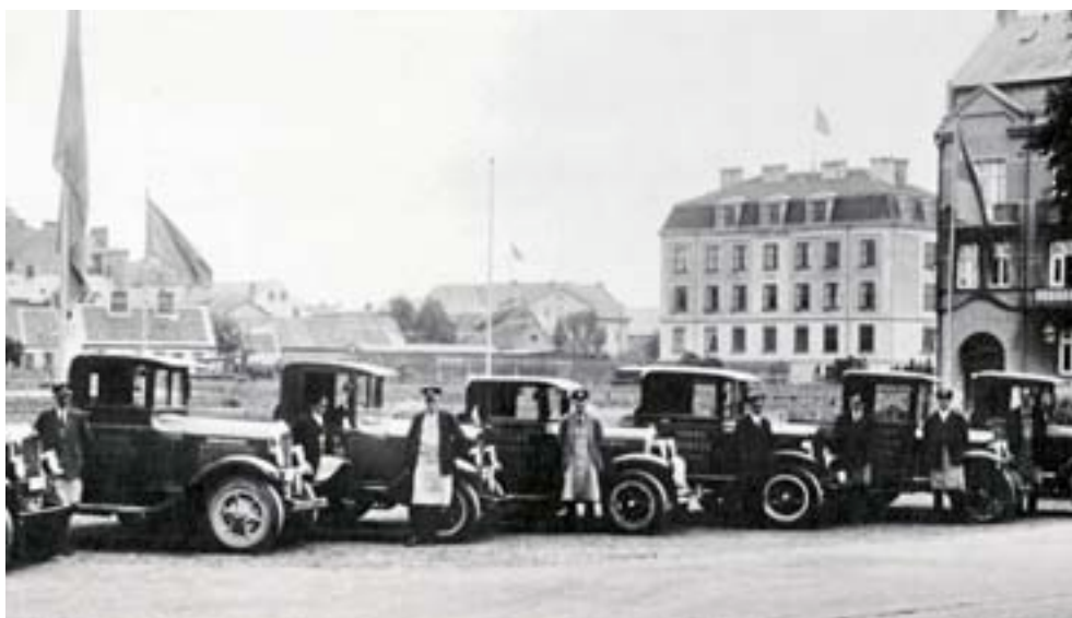
Fordonsflottan på parad med flickskolan i bakgrunden