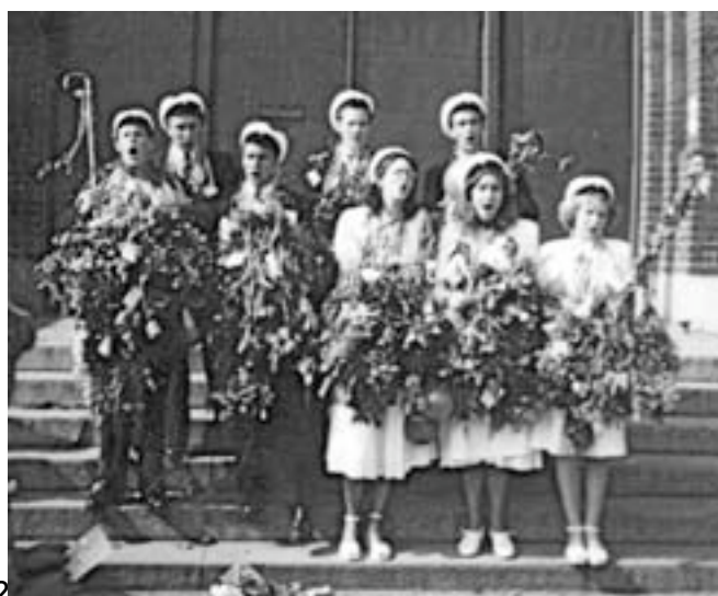
8 st dag 2