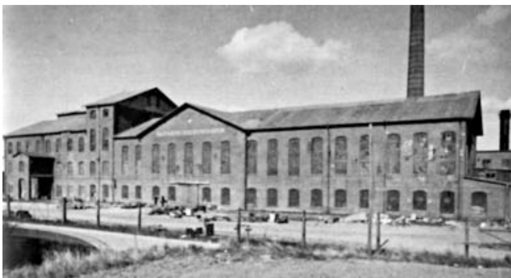
Skivarps sockerbruk 1900

Sockerbetan tror jag kom till heders under första världskriget med ett antal sockerbruk i Skåne och på Gotland. Det var en tillgång också under andra världskrigets avspärning. Nu har danskarna tagit över sötsakerna.