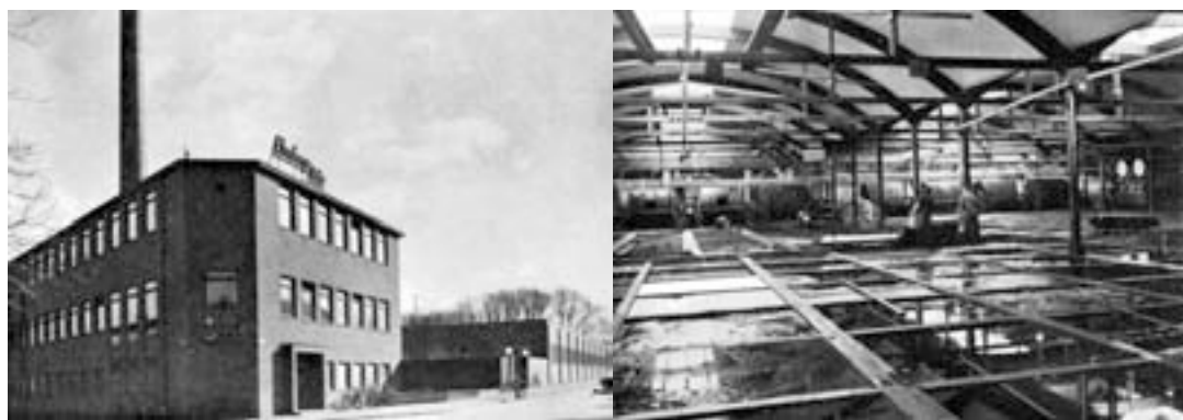
Ehrnbergs Läder, kontor & garvkar

Ehrnbergs Läder i Simrishamn är ett exempel, som - dock med mycket av hudarna importerade - hade vuxit fram ur hantverksmässiga garverimetoder.