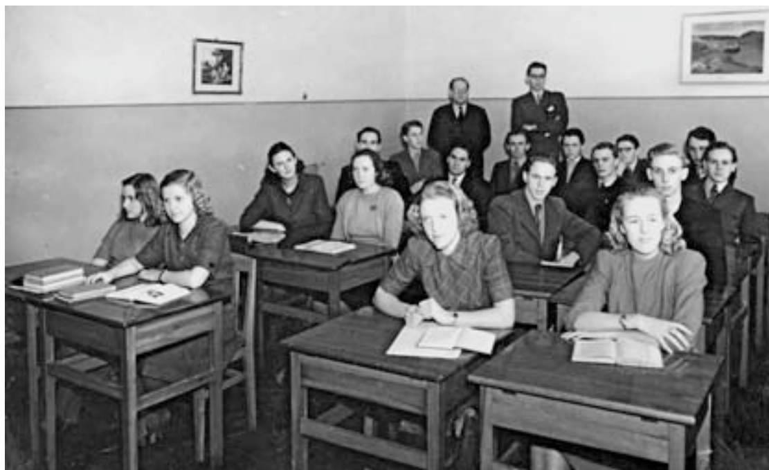
Kunskapsverkstaden R II 1947

Det var ett intressant gäng och underbara kompisar som skulle hålla ihop i vått och torrt i 3 år.