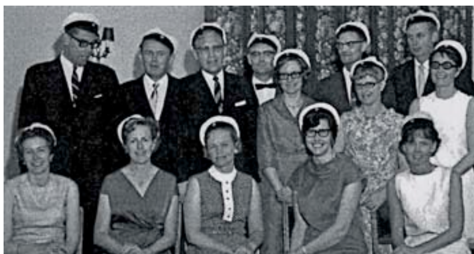
1968 var också latinlinjen representerad