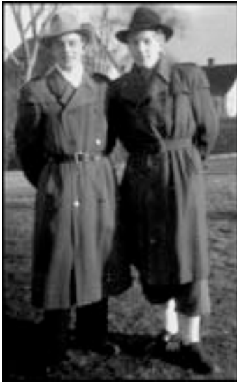
Klädelegans i swingpjattens tecken