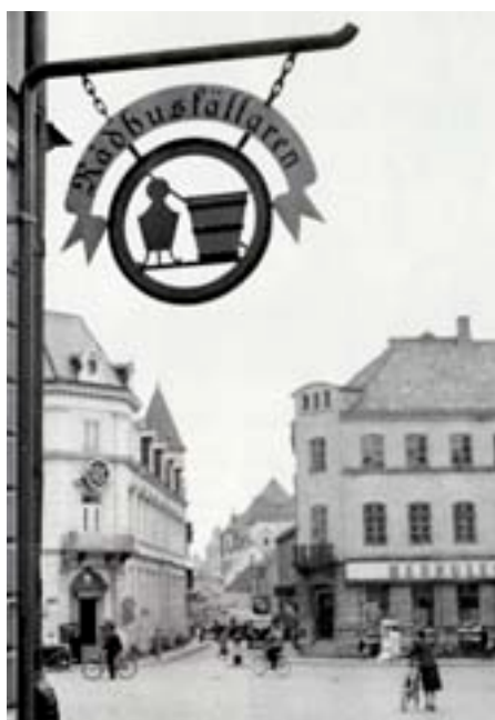
Ystergatans mynning mot Stortorget

När bion var slut, var det dags att göra “Ystergatan” två varv. Även flickskolans elever fann det intressant att ta en kvällstripp, så det blev väl en och annan kommentar om betydelsen av vackra flickor i centrummiljön.