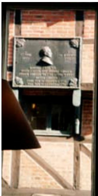
Skylten på Karl XII-huset

Efter ett läxpass var det skön avkoppling att dra iväg in till Stortorget där salta gänget samlades och kommenterade dagens aktuellt. Man kan säga att det var i stället för rapport i TV.