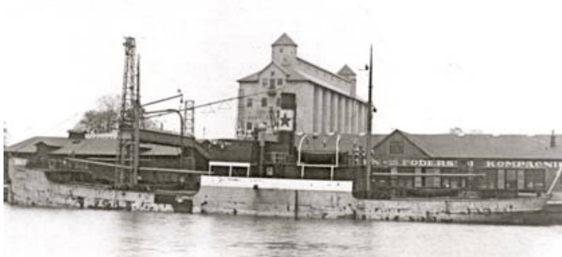
Ångaren Ludwig - satte punkt för farfars tid på sjön.

Det fick bli tåg till Ystad. Någon bil hade vi inte. Privatbilar var för övrigt uppställda i brist på bensin. En del gick på gengas från ved.