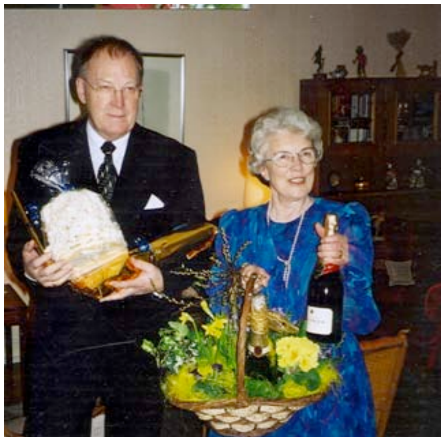
Apropå flickvännen. Det håller än!