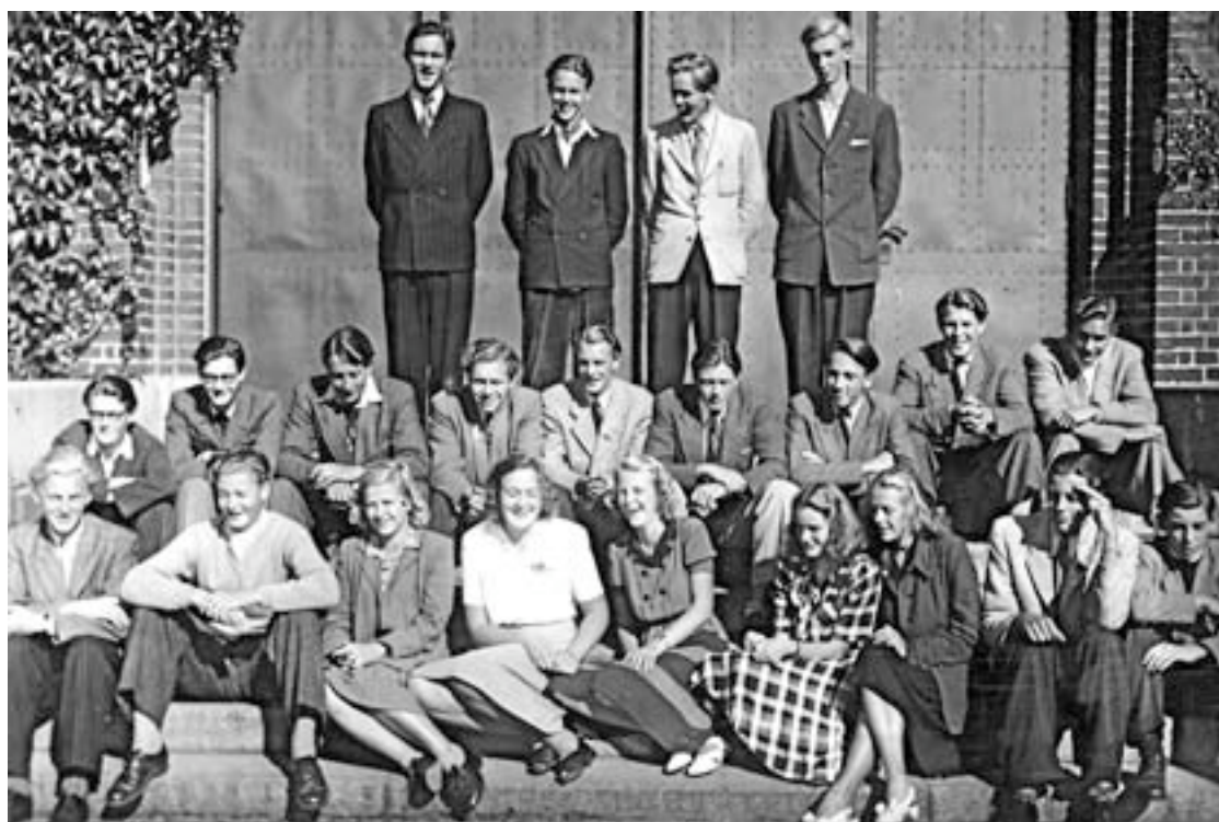
R I, 1946