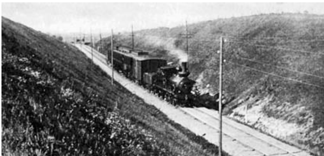
Järnvägen Simrishamn - Ystad

Ångmaskinen eldad med kol gav tågen en alldeles speciell atmosfär. Lokomotiven liknade hotfulla drakar som tjutande intog perrongen och förpackade de väntande i ångmoln, ett utsökt tillfälle att stjäla en sista kyss av flickvännen.